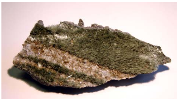
BILD 2: Amiantausscheidung auf Amphibol

Beim Lötschberg-Basistunnel wurde das natürliche Mineral Aktinolith angetroffen. Aktinolith ist in alpinen Klüften kalkamphibolführender Gesteine zu finden, d.h. in Amphiboliten, Hornblendefelsen, kristallinen Schiefen und schiefrigen bis massigen amphibolführenden Gneisen. In offenen, normalen Zerrklüften bilden die Aktinolithen stets die Erstausscheidung, meist in Form von senkrecht stehenden, feinsten, rasenartig auftretenden Fasern, welche Amiant oder Bysso-lit genannt werden. Viele der später ausgeschiedenen Mineralien enthalten deshalb Amiant als Einschluss. Liegender, asbestförmiger Aktinolith wird ebenfalls als Bergleder oder Bergkork bezeichnet.